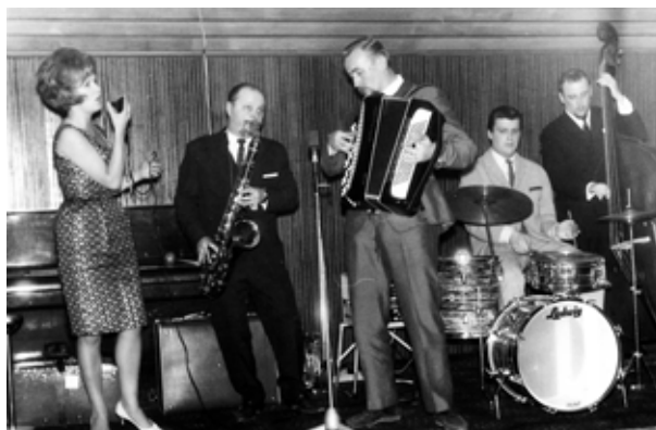
Eila Pienimäki orkestereineen 60-luvulla.